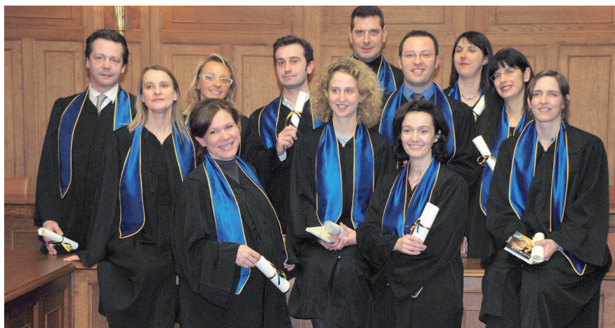
PROMOTION MBA 2007/2008

Les premières cérémonies de remise de diplômes en fin d'année, organisées en présence de parrains prestigieux, doivent être généralisées à toutes les promotions et s'ancrent dans la durée.